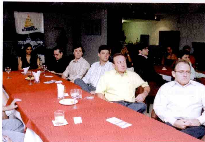
Todos acompanharam atentamente a apresentação