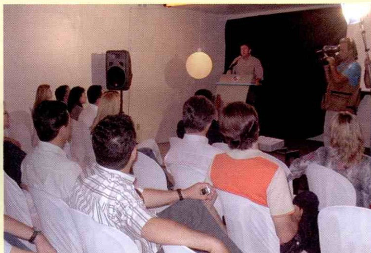
Projeto Cidade Iluminada tern o apoio dos lojistas

Estimular a criatividade e o interesse da populaco de Teresina em fazer a decoraco natalina, visando o embelezamento da cidade no perodo das festas de fim de ano. Diante desta proposta, foi criado o projeto Cidade Iluminada, fruto de uma parceria entre a Camara de Dirigentes Lojistas de Teresina e a TV Clube.