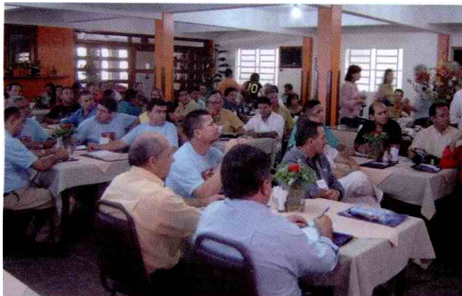
Lojistas de %ferias cidades participaram